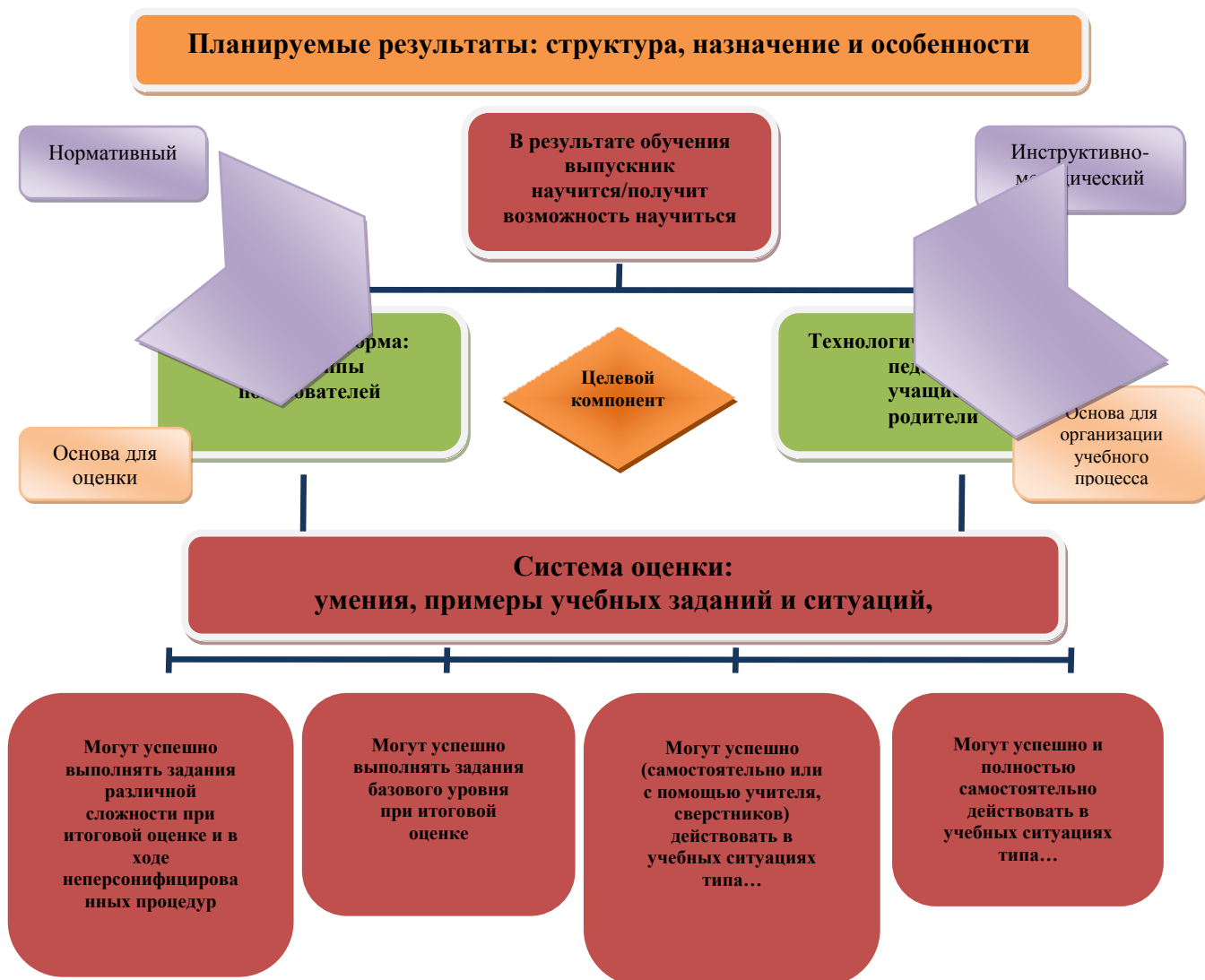
Рис. 1. Особенности структуры планируемых результатов. Функция и назначение.

образовательной программе образовательного учреждения. Используемый образовательным учреждением инструментарий для стартовой диагностики и итоговой оценки (пп. 2—5) приводится в Приложении к образовательной программе образовательного учреждения.